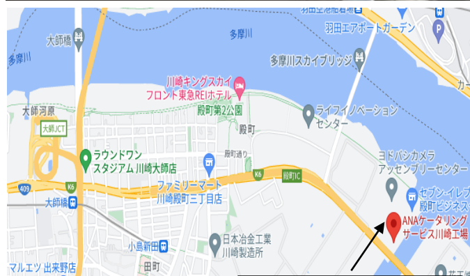
ANA ケータリングサービス川崎工場